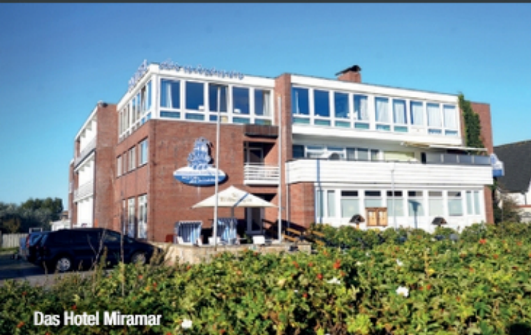
Das Hotel Miramar